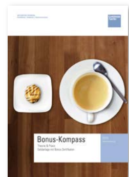
Bonus-Kompass Die beliebte Aktienalternative mal genau unter die Lupe genommen.