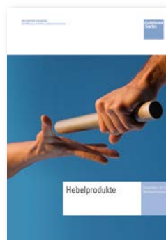
Hebelprodukte-Broschüre Viel Wissenswertes zu Optionscheinen, Mini-Futures, Turbos.