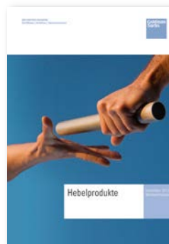
Hebelprodukte-Broschüre Viel Wissenswertes zu Optionscheinen, Mini-Futures, Turbos.