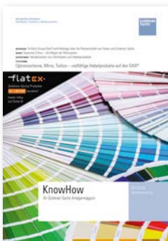
KnowHow Das monatliche Kundenmagazin.

Hier können Sie unsere Publikationen kostenlos bestellen: www.gs.de/newsletter