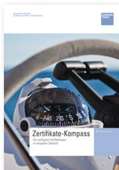
Zertifikate-Kompass Die wichtigsten Zertifikatetypen im kompakten Überblick.