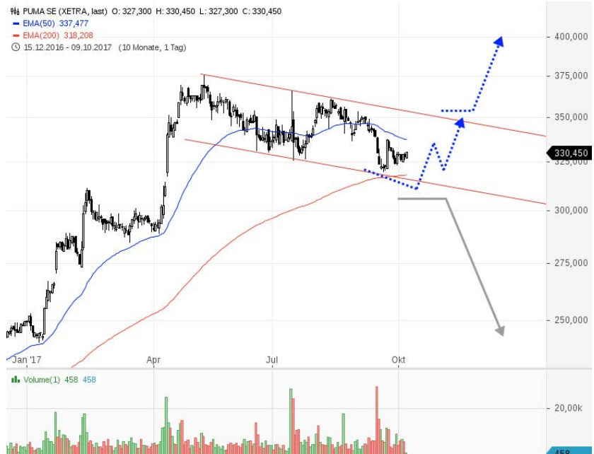
PUMA SE Börse: XETRA / Kursstand: 336,10 Euro Kursverlauf seit 15.12.2016 (log. Kerzenchartdarstellung / 1 Kerze = 1 Tag)

Runden wir das Bild charttechnisch ab, so kann auch von dieser Seite aus ein bullisches Statement abgegeben werden. Zwar befindet sich die Aktie seit Mitte Mai tendenziell auf dem Rückzug, jedoch ließe sich die Abwärtsbewegung ausgehend vom Hoch bei 375,10 EUR als Korrektur im Bullenmarkt werten (bullische Flaggenformation). Zusammen mit der 200-Tagelinie ergibt sich im Preisbereich um 318 EUR ein starkes Unterstützungscluster. Dieses wird im Idealfall genutzt, um eine neue Rally zu initiieren. Im ersten Schritt wäre ein Test der oberen Flaggenbegrenzung im Preisbereich von 352,50 EUR zu erwarten. Kann die dortige Hürde überwunden werden, locken neue Hochs bei 375 und 400 EUR.