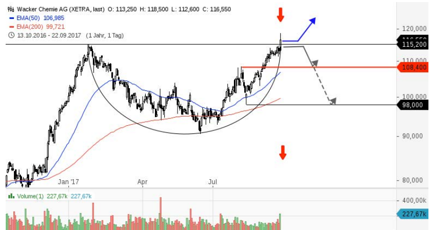
Wacker Chemie AG Börse: XETRA / Kursstand: 117,81 Euro Kursverlauf seit 13.10.2016 (log. Kerzenchartdarstellung / 1 Kerze = 1 Tag)

In den letzten Wochen und Monaten machte der Titel von Wacker Chemie einen recht konstruktiven Eindruck – am vergangenen Freitag brach die Aktie, unter hohem Handelsvolumen, auf ein neues Jahreshoch aus und generierte somit ein Kaufsignal.