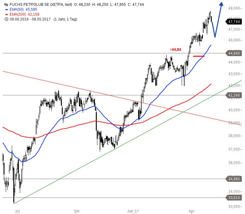
FUCHS PETROLUB SE Börse: XETRA / Kursstand: 48,12 Euro Kursverlauf seit 09.06.2016 (log. Kerzenchartdarstellung / 1 Kerze = 1 Tag)

Damit ist die Rally weiterhin intakt. Der heutige kurstechnische Rückschlag könnte in Kürze wieder wettgemacht werden. Weitere Kursgewinne in Richtung 53 EUR sind durchaus möglich. Ein Rücksetzer in Richtung 44,84 EUR wäre zwar nicht unbedingt schön, aber im Prinzip noch völlig unproblematisch. Erst ein Tagesschlusskurs darunter würde zum Nachdenken Anlass geben.