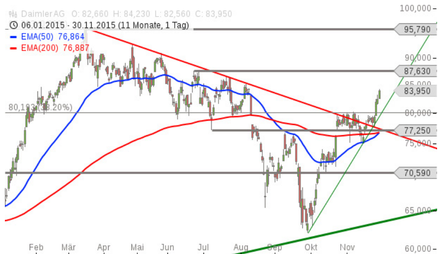
Daimler AG Börse: Xetra in Euro / Kursstand: 85,10 Euro Kursverlauf seit 06.01.2015 (log. Kerzenchartdarstellung / 1 Kerze = 1 Tag)

Rückblick: Zum Jahresstart konnte Daimler, zusammen mit einem sehr starken Automobilssektor, sehr stark zulegen. Die Notierungen haben es geschafft, bis 95,79 Euro durchzustarten, begannen aber auch relativ früh mit einer Konsolidierung. Der Kursverlauf rutschte dann im August verschärft nach unten durch, mit der Entwicklung bei Volkswagen im September sogar noch einmal. Daimler konnte sich aber wieder fangen und seitwärts in den Vorwochen durch den Abwärtstrend schieben. Nun gelingt der Ausbruch aus dieser hohen Konsolidierung.