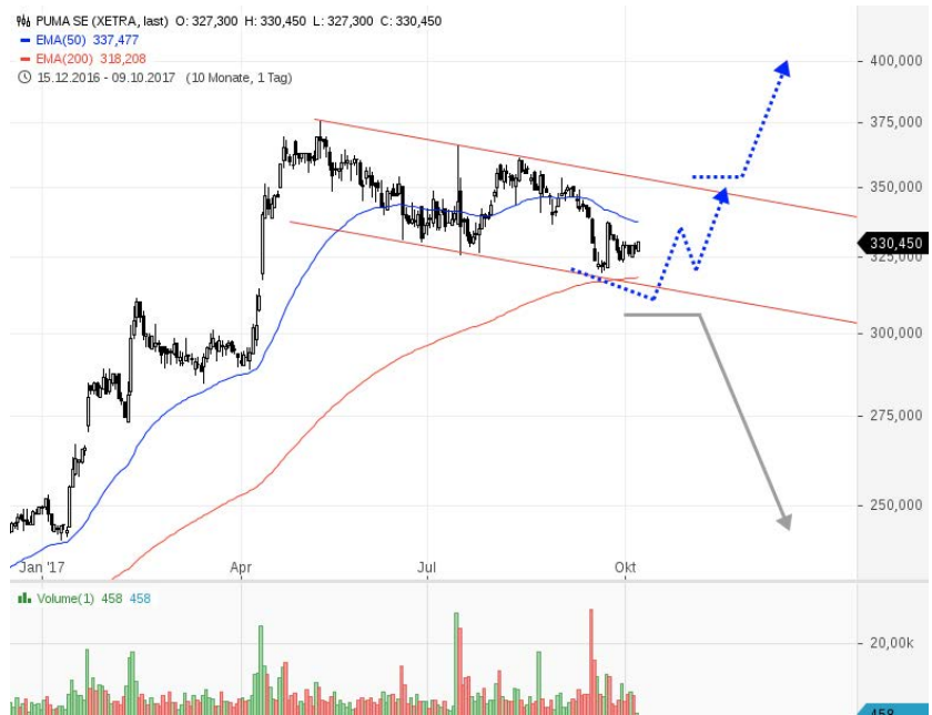
PUMA SE Börse: XETRA / Kursstand: 336,10 Euro Kursverlauf seit 15.12.2016 (log. Kerzenchartdarstellung / 1 Kerze = 1 Tag)

Runden wir das Bild charttechnisch ab, so kann auch von dieser Seite aus ein bullisches Statement abgegeben werden. Zwar befindet sich die Aktie seit Mitte Mai tendenziell auf dem Rückzug, jedoch ließe sich die Abwärtsbewegung ausgehend vom Hoch bei 375,10 EUR als Korrektur im Bullenmarkt werten (bullische Flaggenformation). Zusammen mit der 200-Tagelinie ergibt sich im Preisbereich um 318 EUR ein starkes Unterstützungscluster. Dieses wird im Idealfall genutzt, um eine neue Rally zu initiieren. Im ersten Schritt wäre ein Test der oberen Flaggenbegrenzung im Preisbereich von 352,50 EUR zu erwarten. Kann die dortige Hürde überwunden werden, locken neue Hochs bei 375 und 400 EUR.