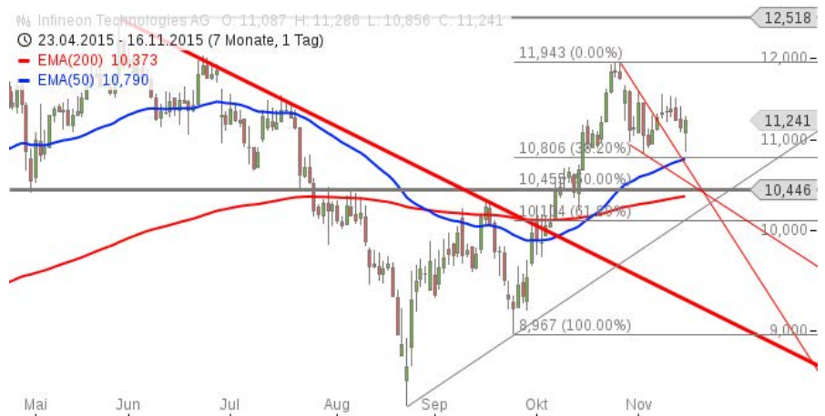
Infineon Technologies AG Börse: Xetra in Euro / Kursstand: 11,33 Euro Kursverlauf seit 23.04.2015 (log. Kerzenchartdarstellung / 1 Kerze = 1 Tag)

Rückblick: Es kam bei Infineon im Sommer zu einer Topbildung, was mit dem Rückfall unter 10,45 Euro ein Verkaufssignal nach sich gezogen hat. Die Notierungen rutschten daraufhin bis 8,30 Euro zurück, bevor eine Gegenbewegung eingeleitet wurde. Nach einem ersten Scheitern am EMA 200 ging es im Oktober darüber hinaus, bevor mit dem Überwinden der 10,45 Euro ein Folgekaufsignal generiert wurde. Die Notierungen zeigten sich stark gegenüber dem Gesamtmarkt und rutschten zuletzt ausgehend von 11,94 Euro leicht zurück.