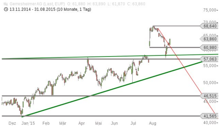
Gerresheimer AG Börse: Xetra in Euro / Kursstand: 63,68 Euro Kursverlauf seit 13.11.2014 (log. Kerzenchartdarstellung / 1 Kerze = 1 Tag)

Rückblick: Anfang Januar konnte Gerresheimer eine Bodenbildung zwischen 41,56 Euro und 46,52 Euro abschließen und sich an die Hochs der Vorjahre bei 57,00 Euro bewegen. Der Anstieg wurde dann auf erhöhtem Niveau konsolidiert, bevor Ende Juli ein starker Ausbruch nach oben gestartet werden konnte. Knapp unterhalb der 70,00 Euro kam Gerresheimer dann aber nicht weiter und leitete eine Korrektur ein. Dabei ging es im schwachen Marktumfeld verstärkt zurück, was einen Schluss des Ausbruchsgaps nach sich gezogen hat. Die Aktien prallten hier wieder nach oben ab und verlassen nun den Abwärtstrend der Vorwochen.