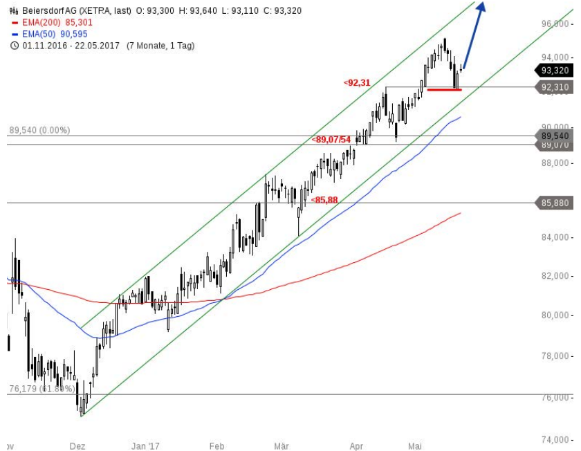
Beiersdorf AG Börse: XETRA / Kursstand: 94,22 Euro Kursverlauf seit 01.11.2016 (log. Kerzenchartdarstellung / 1 Kerze = 1 Tag)

Beiersdorf befindet sich in einem mittelfristigen Aufwärtstrend. Innerhalb dieses Trends kletterte die Aktie bis auf 15. Mai 2017 auf ihr aktuelles Allzeithoch bei 95,15 EUR. In den letzten Tagen gab der Wert allerdings wieder etwas nach. Am Donnerstag fiel er auf das letzte Zwischenhoch bei 92,31 EUR zurück. Dort dreht die Aktie seit Freitag wieder nach oben.