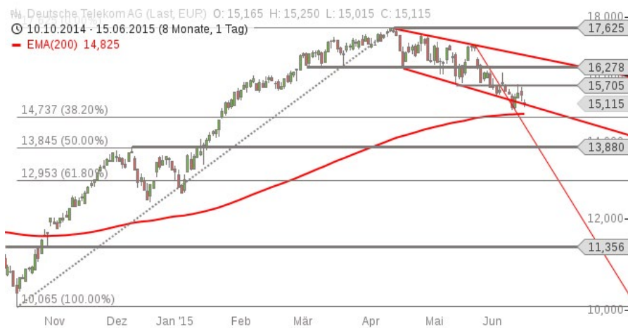
Deutsche Telekom Börse: Xetra in Euro / Kursstand: 14,93 Euro Kursverlauf seit 10.10.2014 (log. Kerzenchartdarstellung / 1 Kerze = 1 Tag)

Rückblick: Im vergangenen Herbst konnten die Aktien der Deutschen Telekom ausgehend von 10,07 Euro zu einer sehr umfassenden Rally starten. Im Frühjahr wurde es innerhalb der Rally zunehmend enger, bevor ausgehend von 17,63 Euro eine Konsolidierung eingeleitet wurde. Der Rückfall unter 16,28 Euro löste dann ein kleines Verkaufssignal aus und bestätigte ein kleines Top. Die Notierungen bewegten sich dabei zunächst in einem moderaten Trendkanal, dessen Unterkante nun aber nicht mehr vollständig gehalten werden kann.