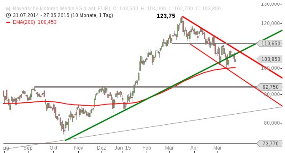
BMW Börse: Xetra in Euro / Kursstand: 104,88 Euro Kursverlauf seit 31.07.2014 (log. Kerzenchartdarstellung / 1 Kerze = 1 Tag)

Rückblick: Bei BMW kam es im Herbst zur Ausbildung einer bullisch inversen SKS-Formation oberhalb der 73,77 Euro. Diese wurde nach dem Jahreswechsel mit dem Ausbruch über 92,75 Euro ausgelöst, welcher einen starken Anstieg eingeleitet hat. Die Notierungen konnten sich bis auf 123,75 Euro bewegen, bildeten dann aber auf hohem Niveau eine kleine bärische Trendwende aus. Diese wurde mit dem Rückfall unter 110,65 Euro ausgelöst, was zuletzt die Ausbildung eines Abwärts gerichteten Trendkanals zur Folge hatte.