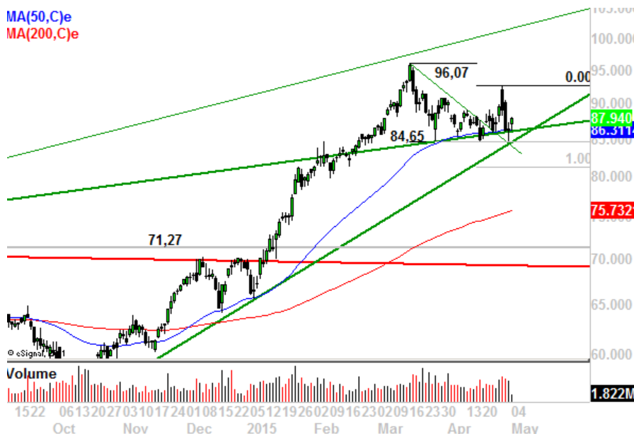
Daimler Börse: Xetra in Euro / Kursstand: 87,70 Euro Kursverlauf seit 11.09.2014 (log. Kerzenchartdarstellung / 1 Kerze = 1 Tag)

Rückblick: Bei Daimler kam es nach dem Jahreswechsel zu einem nachhaltigen Ausbruch aus einer flachen Korrektur, welche auch sofort über 71,27 Euro auf ein neues Hoch geführt hat. Die Notierungen konnten sich dann auch im starken Markt steil nach oben absetzen und aus dem langfristigen Trendkanal nach oben ausbrechen. Es gelang damit der Anstieg bis 96,07 Euro, welcher nun seit einigen Wochen konsolidiert wird. Daimler bewegt sich dabei seitwärts an der gebrochenen Trendkanaloberkante entlang. Der Versuch, sich davon deutlicher zu lösen, wurde zum Ende der vergangenen Woche noch einmal abverkauft.