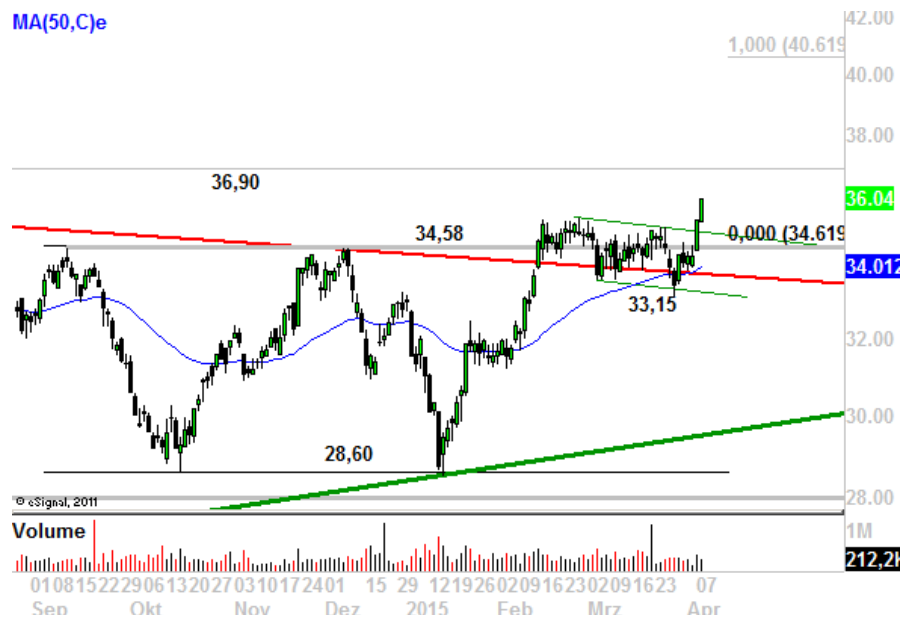
Voestalpine Börse: Wien in Euro / Kursstand: 35,93 Euro Kursverlauf seit 27.08.2014 (log. Kerzenchartdarstellung / 1 Kerze = 1 Tag)

Rückblick: Bis auf 36,90 Euro konnte Voestalpine im Verlauf 2013 in einer starken Bewegung ansteigen. Die Notierungen haben anschließend korrigiert und fielen in eine ausgedehnte Seitwärtsbewegung zurück. Die zwischen 28,60 Euro und 34,58 Euro liegende Seitwärtszone wurde dann nach dem Jahreswechsel wieder nach oben vollständig durchlaufen, was auch einen Ausbruch über 34,58 Euro nach sich gezogen hat. Die Notierungen bildeten dann eine bullische Flagge im Bereich der Ausbruchszone aus, welche nun nach oben aufgelöst wird.