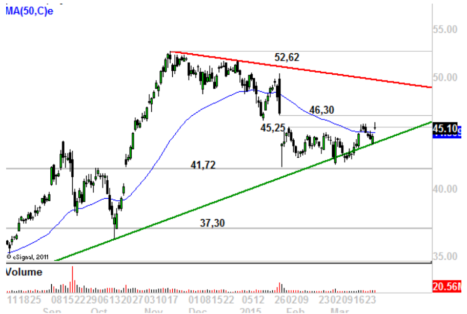
Yahoo Börse: Nasdaq in US Dollar / Kursstand: 44,81 USD Kursverlauf seit 11.08.2014 (log. Kerzenchartdarstellung / 1 Kerze = 1 Tag)

Rückblick: Bei Yahoo kam es im vergangenen Jahr zu einem final sehr steilen Anstieg bis 52,62 USD. Diese Rally wurde zunächst flach auf hohem Niveau konsolidiert, im neuen Jahr rutschte Yahoo dann aber doch einmal stärker zurück. Es ging bis auf 41,72 USD, bevor sich die Notierungen auf dieser wichtigen Unterstützung seitwärts bewegen konnten. Der maßgebende Aufwärtstrend der vergangenen Jahre kann Yahoo nun langsam wieder nach oben hebeln. Die Notierungen laufen dabei leicht in das noch offene Gap Down zwischen 45,25 USD und 46,30 USD hinein.