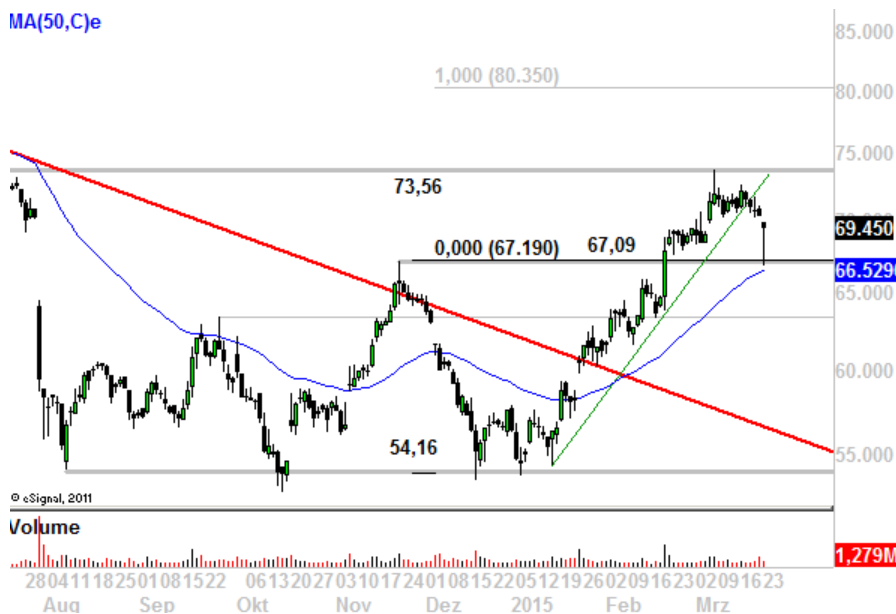
Adidas Börse: Xetra in Euro / Kursstand: 68,60 Euro Kursverlauf seit 23.07.2014 (log. Kerzenchartdarstellung / 1 Kerze = 1 Tag)

Rückblick: Bei Adidas kam es im Verlauf 2014 zu einer massiven Underperformance, sowie einem starken Kurseinbruch. Die Notierungen konnten sich dann bei 54,16 Euro fangen und in der Folge über den Herbst eine größere Seitwärtsbewegung starten. Zum Ende des Jahres wurden die 54,16 Euro erneut mehrfach getestet und der Kurs konnte sich wieder klar nach oben schieben. Nach dem Ausbruch aus dem mittelfristigen Abwärtstrend gelang auch der Ausbruch über 67,09 Euro, bevor der langfristig wichtige Widerstand bei 73,56 Euro eine Korrektur eingeleitet hat. Aktuell bildet Adidas einen Pullback auf die 67,09 Euro aus.